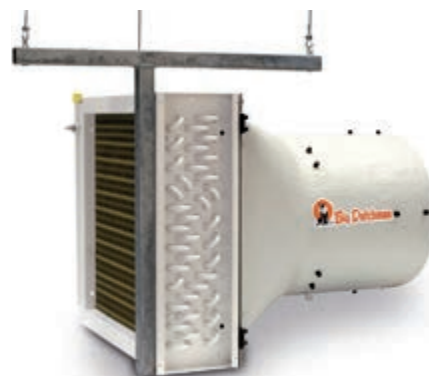
HeatMaster серии H

Приборы HeatMaster серии R и V подвешиваются по центру птичника на равном расстоянии друг от друга с учетом дальности их струи, на высоте одного метра над участком с птицей. Регулировка осуществляется с помощью лебедки. Воздух поступает из верхних участков помещения и проходит через пластинчатый элемент, омываемый потоком горячей воды. При работе с моделью R вентилятор нагнетает теплый воздух в зону нахож-