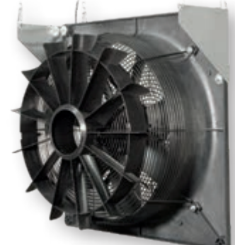
Циркуляционный вентилятор FC050-4EQ с колесом спрямления воздушного потока