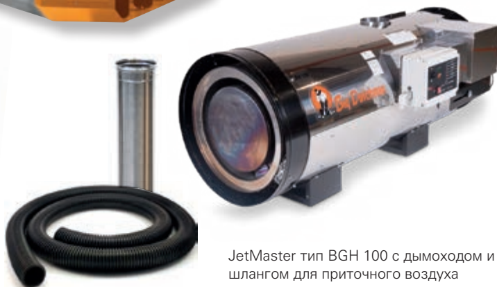
JetMaster тип BGH 100 с дымоходом и шлангом для приточного воздуха