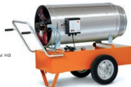
JetMaster серии P 80 для работы на топочном топливе, переносной