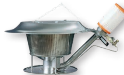
Газовый излучатель серии G12