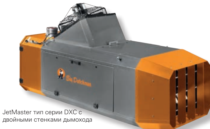
JetMaster тип серии DXC с двойными стенками дымохода