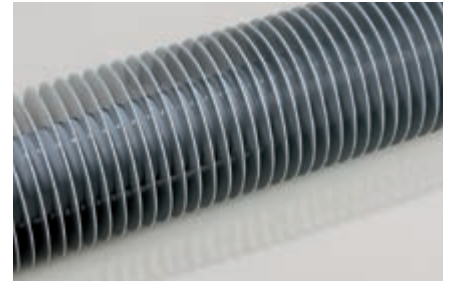
Отопление на основе ребристых труб из алюминия

* VL 90° C/RL 70° C (температура на линии подачи и обратки) и 35° C температура окружающей среды