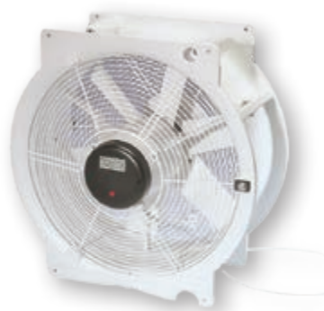
Циркуляционный вентилятор 6E50

Высокопроизводительный циркуляционный вентилятор FC050-4EQ оснащен к тому же колесом спрямления воздушного потока. Благодаря высокой дальности струи и сфокусированному потоку воздуха вентилятор оптимален для эксплуатации в условиях узких и низких корпусов, а также при использовании теплообменника Early.