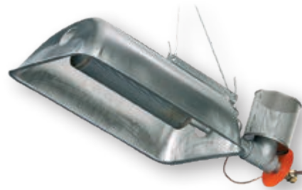
Газовый излучатель серии M8

Показатели для подключения газового излучателя G 12: 230 В, 50 Гц