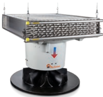
HeatMaster серии V