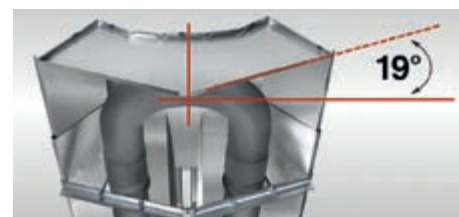
Дефлектор с оптимальным углом излучения тепла