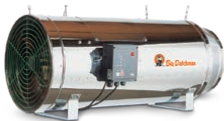
JetMaster серии P 100 для работы на топочном топливе