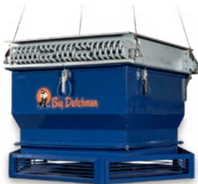
HeatMaster серии R

масле. Особенно предпочтительным является использование тепла, вырабатываемого блочными электростанциями или биогазовыми установками. Big Dutchman может предложить вам три разных модели данных приборов, состоящих из пластинчатого элемента, вентилятора и распределителя.