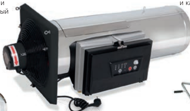
JetMaster серии GP 70 различных типов для работы на природном газе или пропане