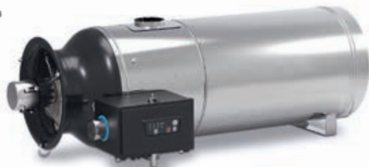
JetMaster тип RGA 100 с двойными стенками дымохода